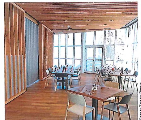
Bayern ohne Hirschgeweih: Globaler Tourismus trifft heimisches Handwerk