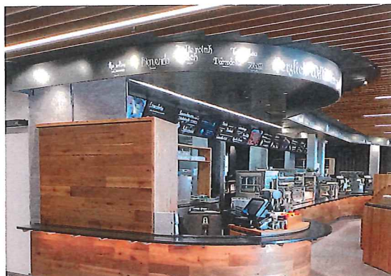
Eiche in trockener Luft: das Gipfelklima wurde konstruktiv berücksichtigt – das Holz kann überall arbeiten

Bayerische Zugspitzbahn AG 82467 Garmisch-Partenkirchen www.zugspitze.de